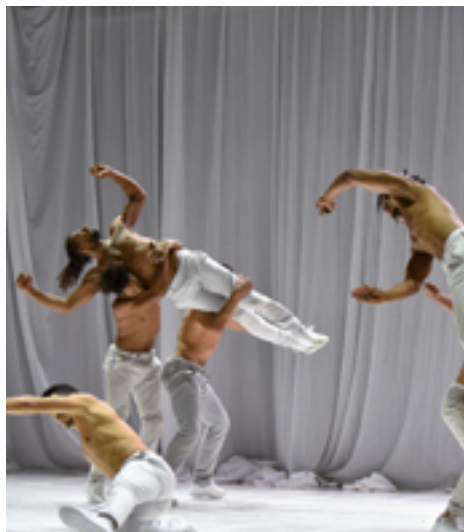
ven. 10 février 21h BOYS DON'T CRY DANSE CONTEMPORAINE URBAINE