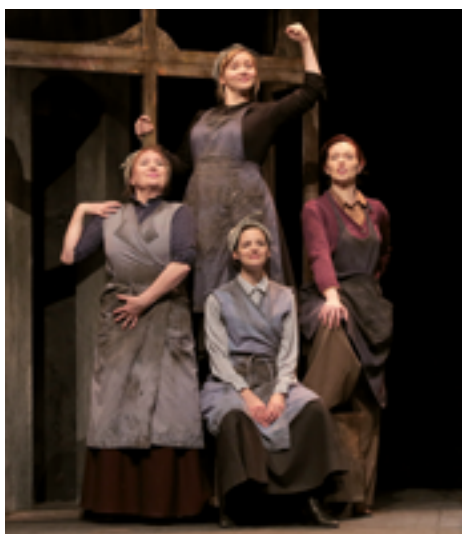
ven. 9 juin 20h LES FILLES AUX MAINS JAUNES THÉÂTRE