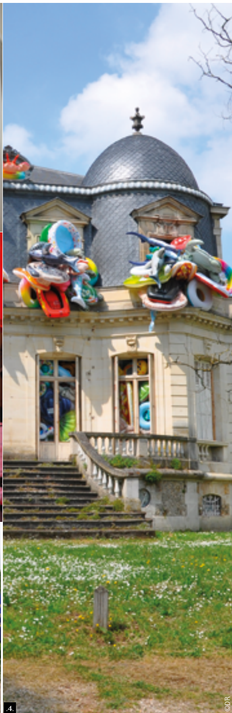
1. Les invités du mois à la Galerie des passions : les classes d'arts plastiques du collège Saint-Exupéry .2. Je lis avec mes parents 3. Commémoration du 8 mai .4. 26 e édition de Sculptures en l'Île