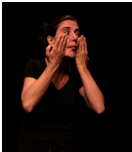
ven. 26 mai 20h LES CONTES DITS DU BOUT DES DOIGTS THÉÂTRE ✍