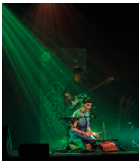
jeu. 6 et ven. 7 avr. 10h-14h30 DANS LES BOIS SPECTACLE MUSICAL