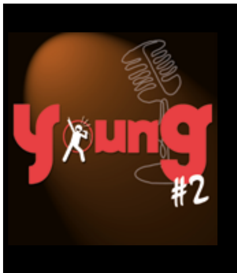
sam. 18 mars 18h FESTIVAL YOUNG FESTIVAL