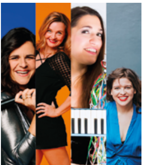
ven. 23 juin 21h PLEASE STAND UP! HUMOUR - STAND UP