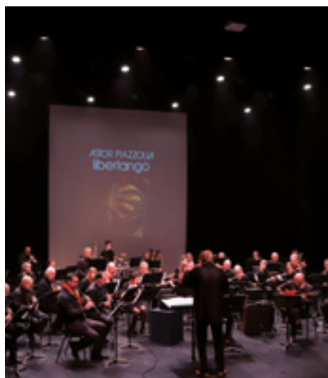
ven. 31 mars 21h GPSEORCHESTRA - TANGO CONCERT