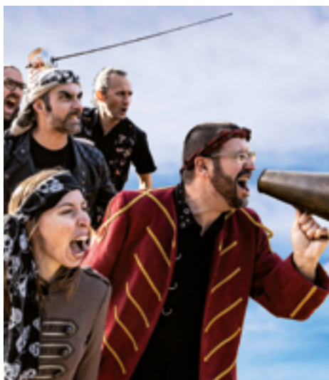
sam. 15 avril 16h LES PIRATES ATTAQUENT CONCERT ROCK